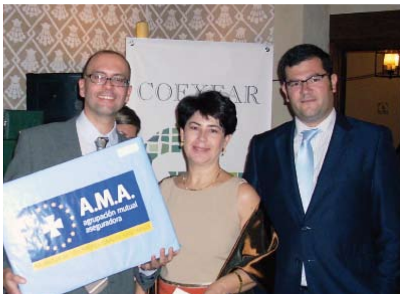
Fiesta de la patrona del Colegio de Farmacéuticos de Cáceres y Badajoz.