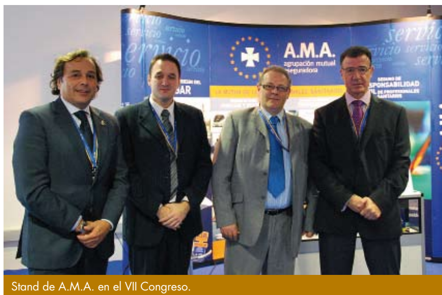
Stand de A.M.A. en el VII Congreso.