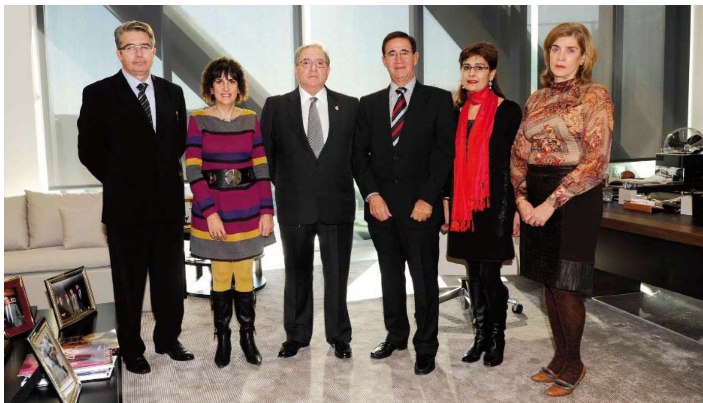
Foto de familia de la firma del convenio con los enfermeros castellanoleoneses.

Desde 2010, la Mutua viene aplicando un ambicioso plan de expansión comercial por toda España y Portugal, que ha cristalizado en la suscripción de numerosos convenios nuevos con profesionales sanitarios y sus Colegios y demás instituciones representativas.