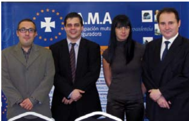
Stand de A.M.A. en el Congreso.