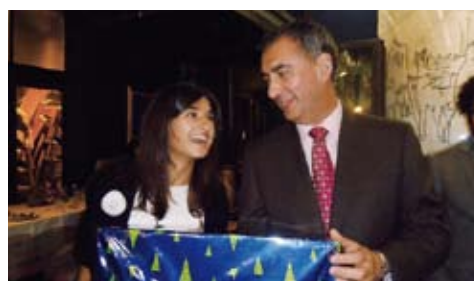
Colegio de Farmacéuticos de León.