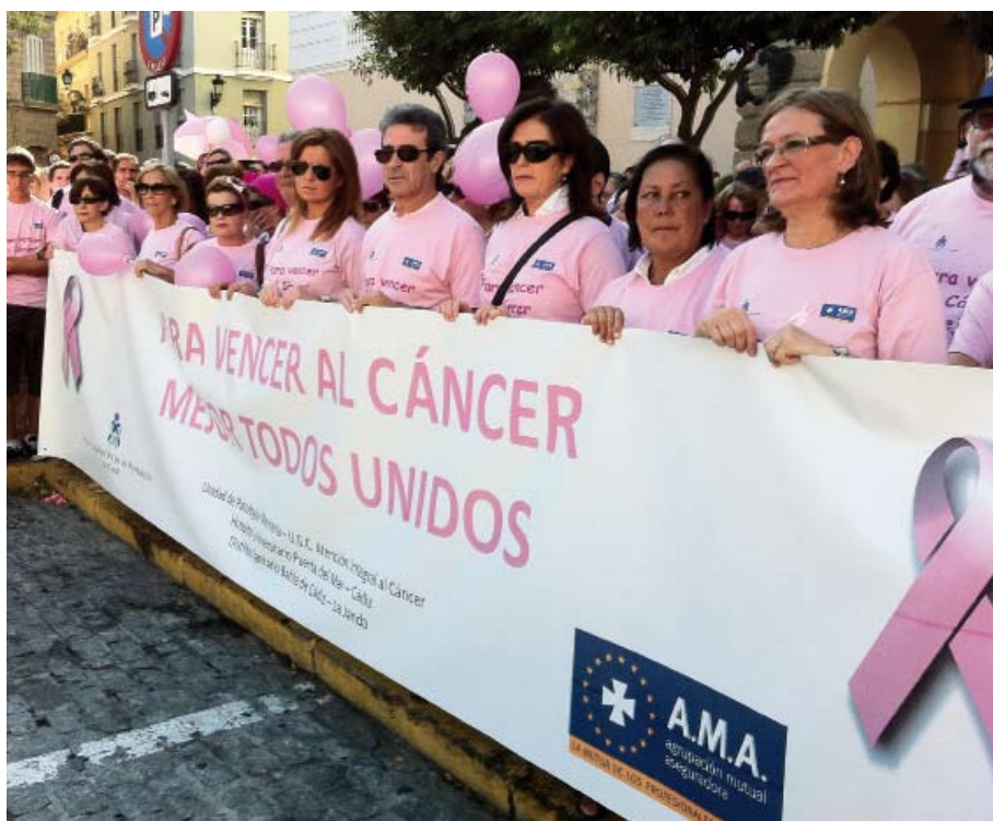
Cabecera de la marcha, que contó con el patrocinio de A.M.A.

Esta canción es el tema principal del vídeo Bailando en rosa , protagonizado