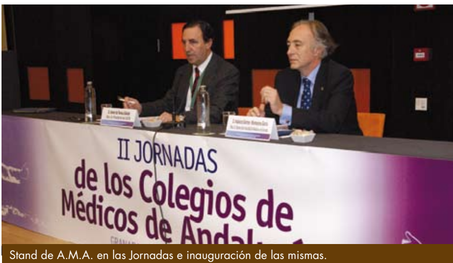
Stand de A.M.A. en las Jornadas e inauguración de las mismas.

Las jornadas abordaron los aspectos más candentes y de interés en estos momentos para la profesión médica, entre ellos, profesionalismo y el papel de los Colegios de Médicos, el buen gobierno sanitario y la sostenibilidad del sistema sanitario desde el profesionalismo y desde la perspectiva de la deontología médica.